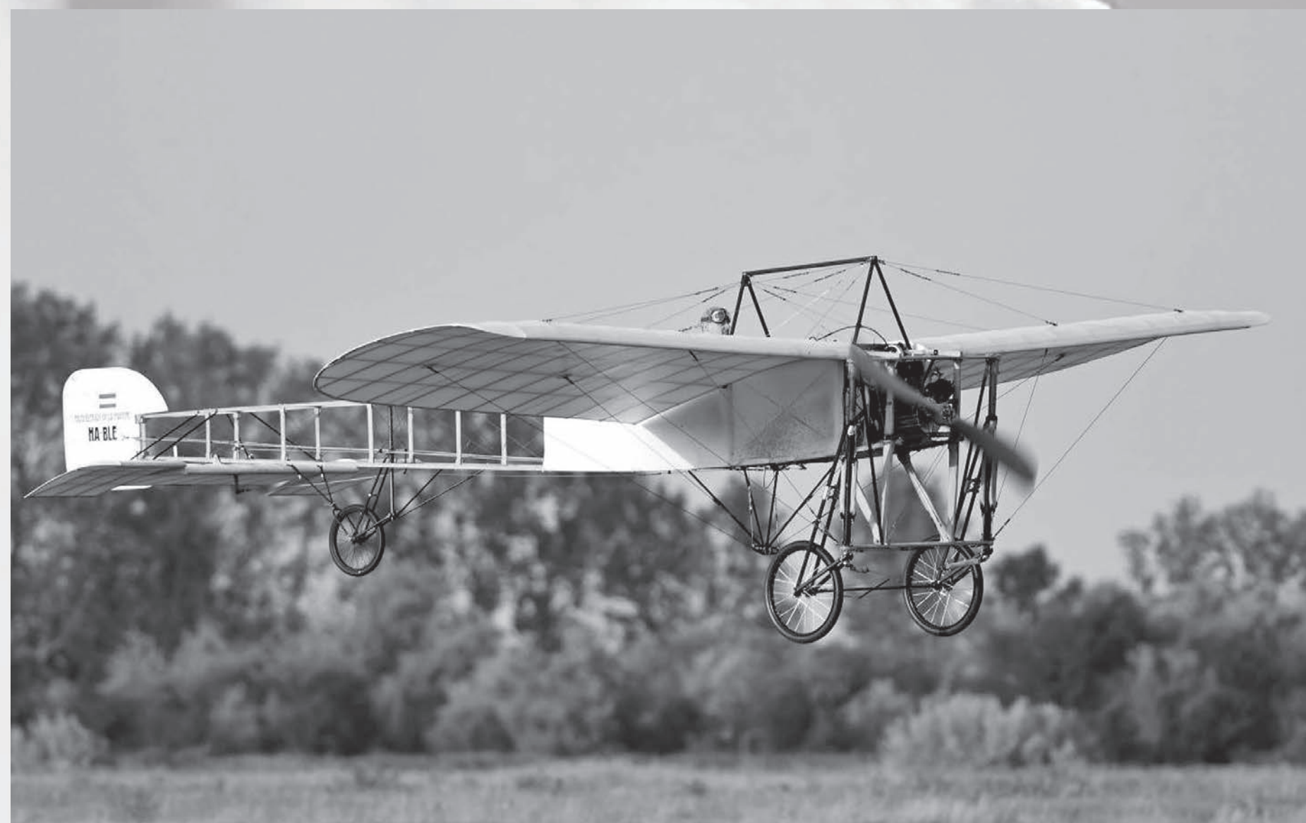
Monoplan Blériot XI