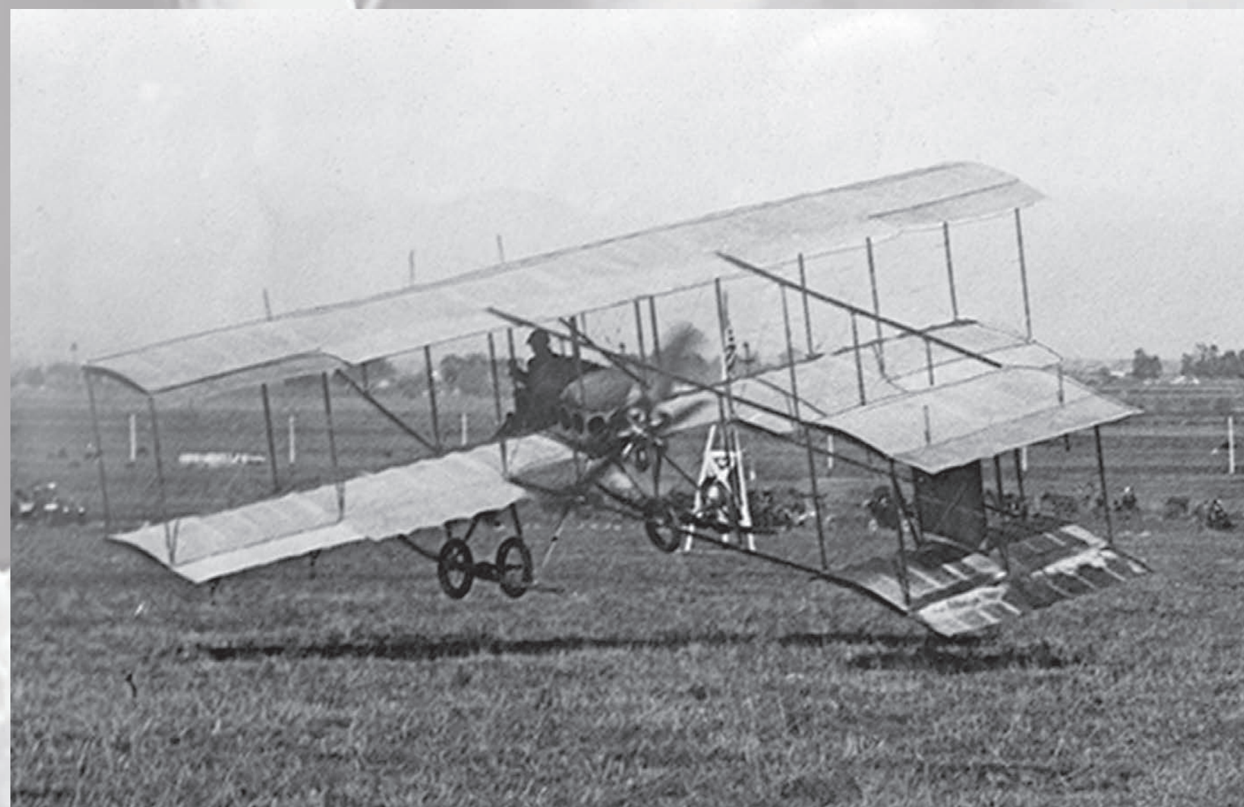
Biplan Farman 1910

Les débuts de l'aviation, de 1906 à 1914 marquent la fin de la Belle Epoque et les aviateurs en sont les nouveaux héros que vont s'arracher les foules dans de très nombreux meetings, de 1910 à 1913.